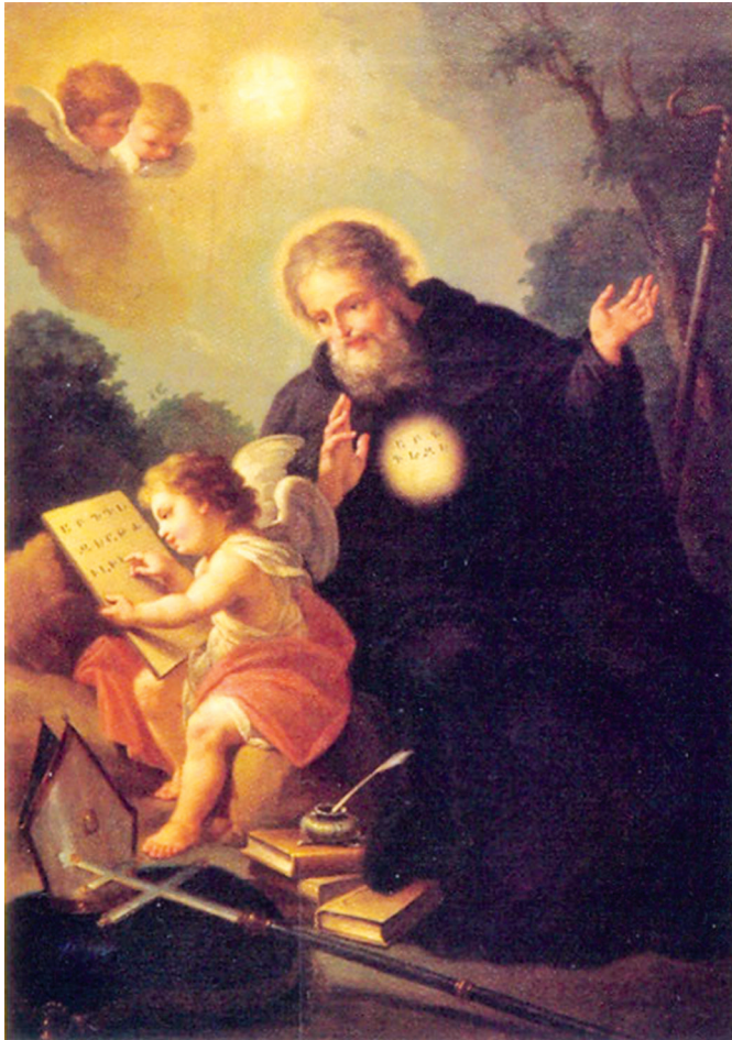
Մեսրոպ Մաշտոց, նկարիչ՝ Ֆ. Մաջուրո, XVIII դ.

Մաշտոցը կանգնած մնաց, ապա՝ արքայի հայացքը որսալով, փեղավորվեց հայոց աշխարհիկ և հոգևոր առաջնորդներից քիչ հեռու, դռան կողքին եղած բազկաթոռին: Ջրույցը կարճ էր ու գործնական: Միջազեպքում թագավորին ծանոթ Դանիել անունով ասորի եպիսկոպոսի մոտ, նրա հայտնած փեղելության համաձայն, հայոց նշանագրեր կան: Թե ինչ գրեր են դրանք, ովքեր են հորինել՝ ոչ ոք չգիտի: Կաթողիկոսը և վարդապետը խնդրում են թագավորին օգնել դրանք ձեռք բերելու: Վռամշապուհը խոստանում է և կատարում իր խոստումը: