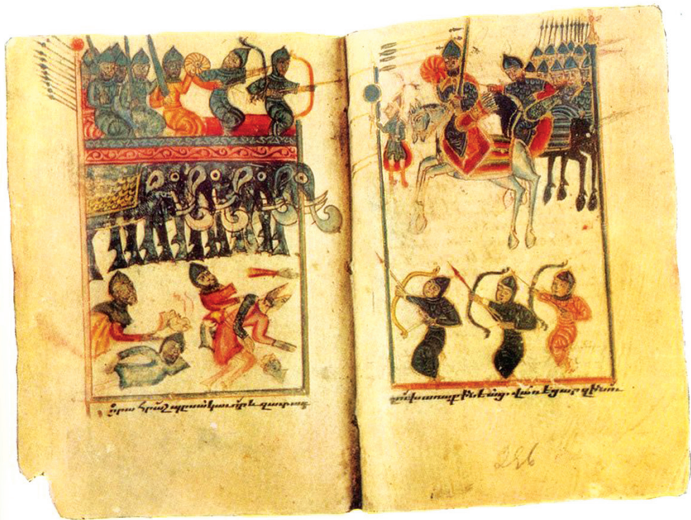
Դրվագներ Ավարայրի ճակատամարտից, 1482 թ., Շարակնոց, հեղինակ՝ Կարապետ Բերկրեցի