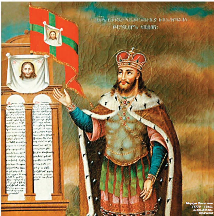
Արգար թագավոր, նկարիչ՝ Մ. Հովնաթանյան

Շատ փարիներ անց ալանների թագավոր Գիգիանոսը պատվիրում է իր զորավարին գնալ Հայաստան և Սուրիասյանց պատվով հեղբերել, եթե միայն հրաժարվեն քրիստոնեությունից, հակառակ դեպքում՝ սպանել բոլորին: Նրանք մերժում են ալանների թագավորի պահանջը և նահապետակալում Հայաստան գալուց 44 փարի անց: