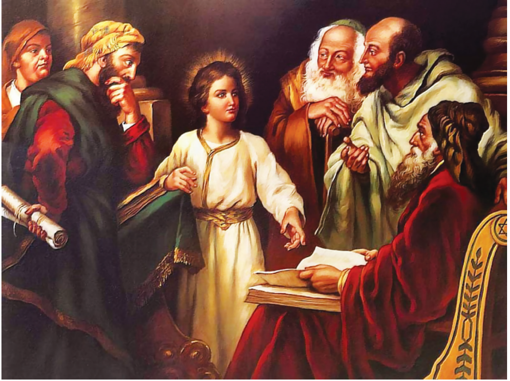
Հիսուսը տաճարում, նկարիչ՝ Հ. Հոֆման