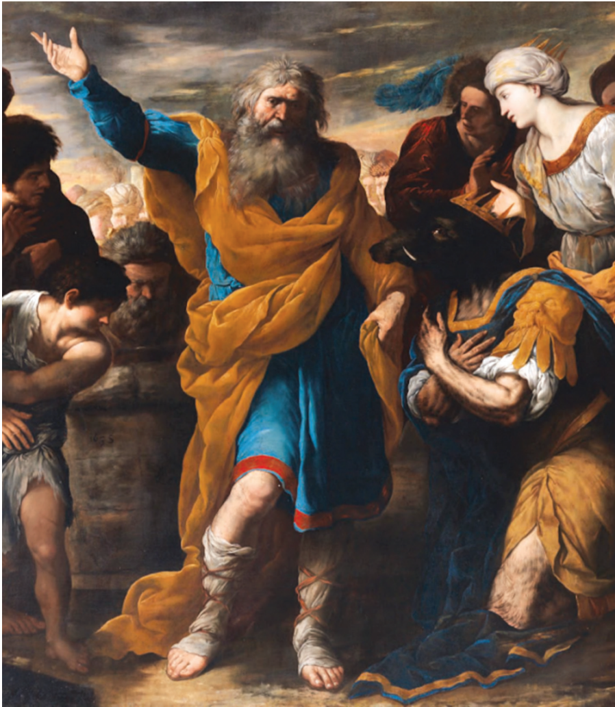
Տրդատ III-ի աղաչում է Գ.Լուսավորչին վերադարձնել իրեն մարդկային կերպարանքը, նկարիչ՝ Ֆ. Ֆրանկանցանո