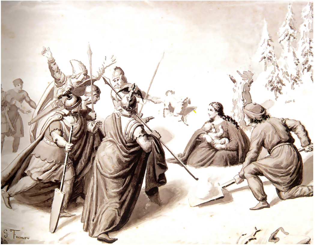
Փոքրիկ Սանապրուկը և Ավդե թագուհին ետորյա ձնաքից հեկո, նկ.' Ջ. Ֆուլարո