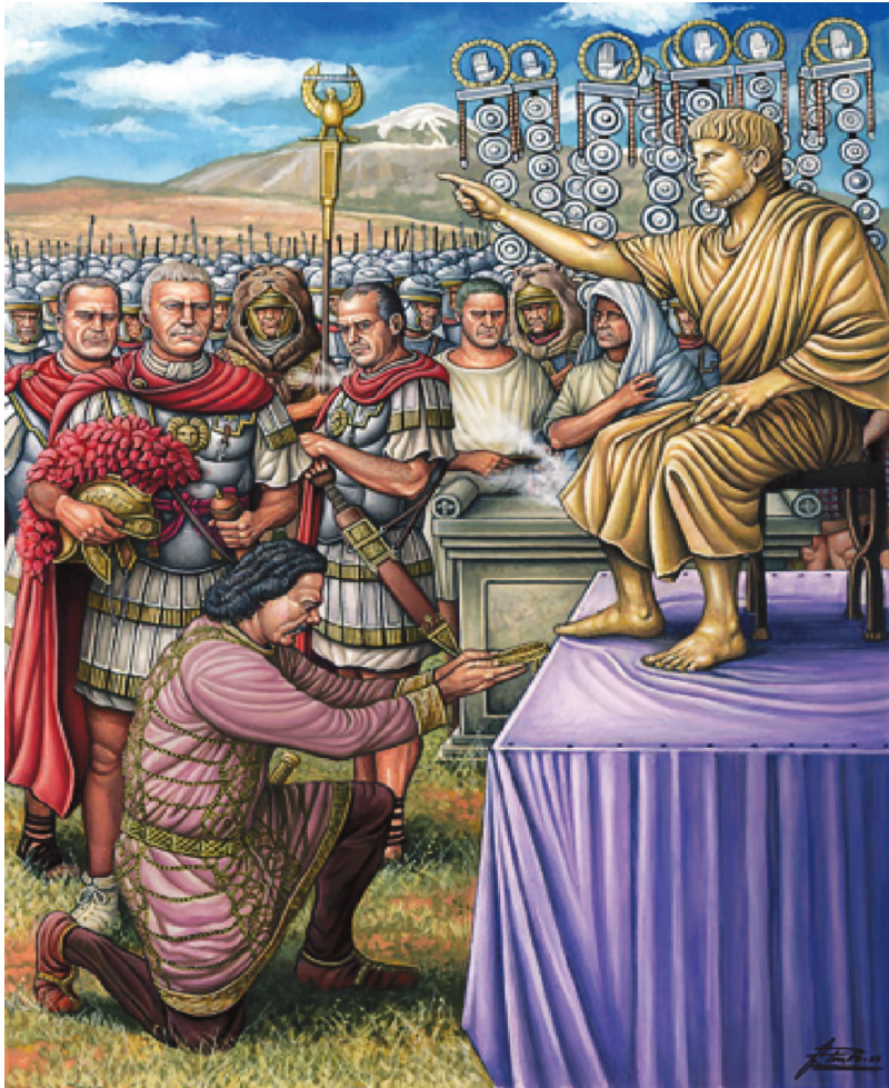
Հայոց Տրդատ արքան Ներոնի արձանի առջև, նկարիչ՝ Ա. Պինյո