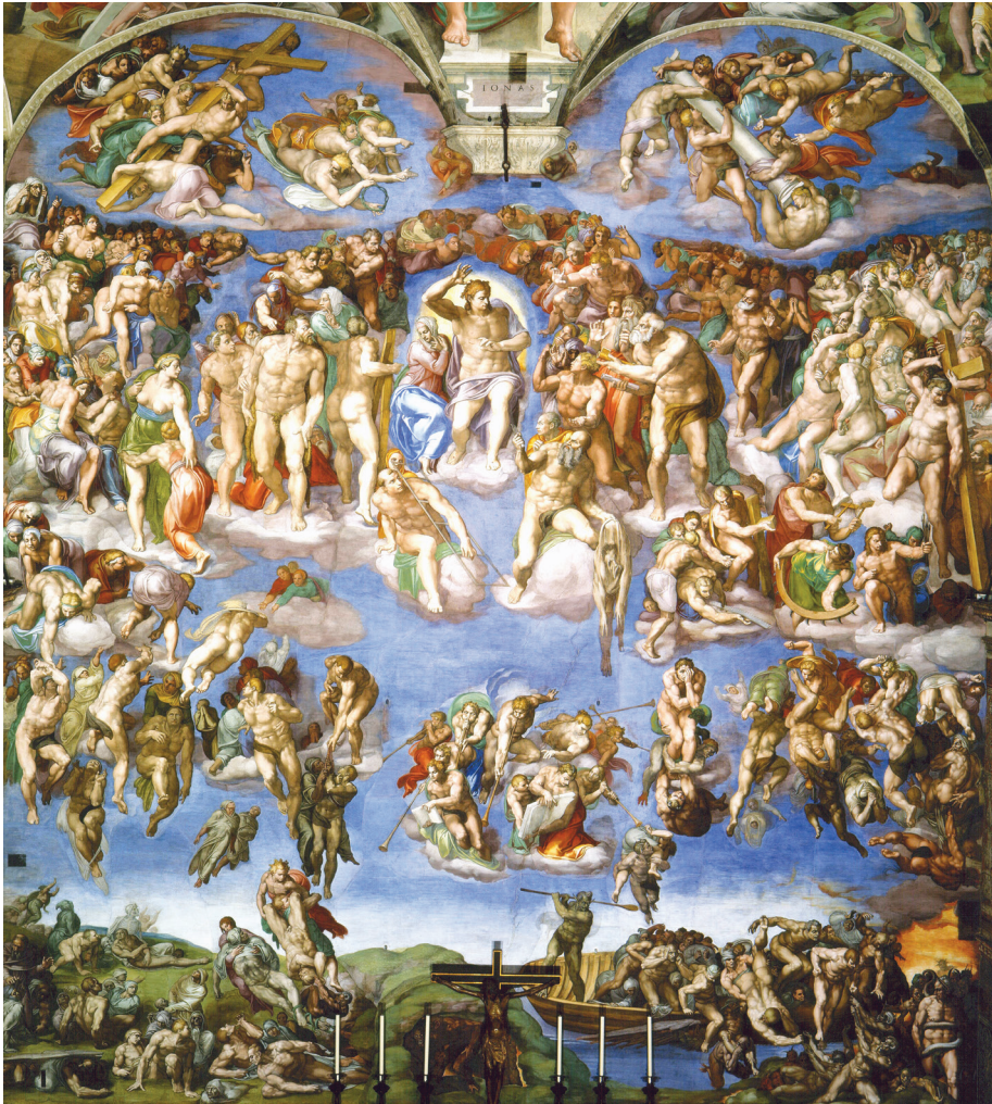
Վերջին դատաստան, հեղինակ՝ Միքելանջելո