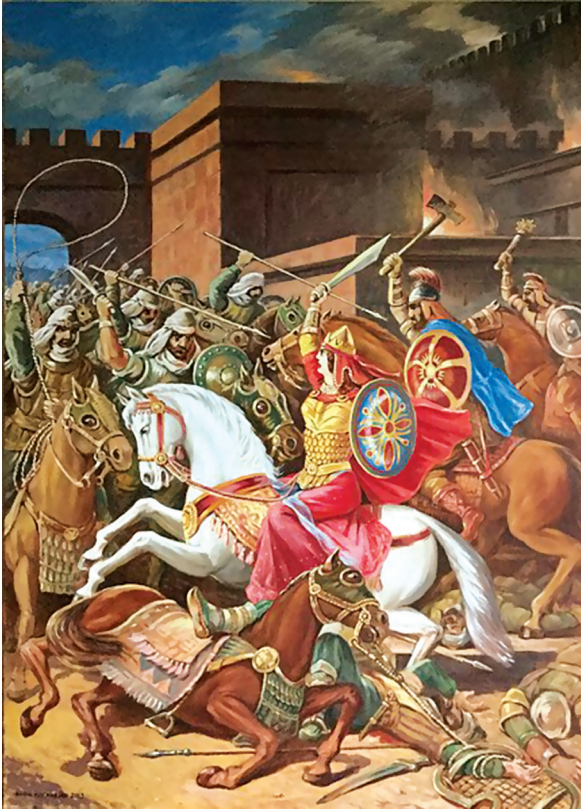
Փառանձեմ թագուհու վերջին կռիվը, նկ.՝ Ռ. Քոչարյան