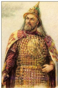
Իշխան Իգոր, կառավարել է 912-945 թթ.

945 թ. Իշխան Իգորը փորձեց դրևլյաններից կրկնակի հարկ հավաքել: Դրևլյանները ապստամբեցին և սպանեցին Իգորին: Իգորի կինը՝ իշխանուհի Օլգան, դաժանորեն ձնշեց ապստամբությունը, սակայն նոր ապստամբությունների տեղիք չտալու համար ստիպված եղավ հարկի կայուն չափ սահմանել: