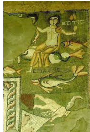
Գառնիի բաղնիքի հափրակի խճանկարը