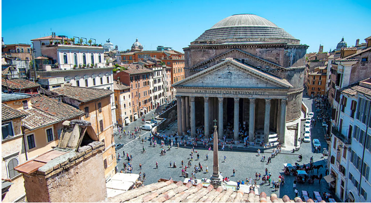
Պանթեոնի փեսքը դրսից

Տրայանոս կայսրը դակերի դեմ իր տարած հաղթանակի պատվին Հռոմում կառուցեց գեղեցիկ շենքերով շրջապատված նոր հրապարակ, որի կենտրոնում կանգնեցված էր 38 մետր բարձրությամբ նրա հուշակոթողը: Ներքևից վերև այն զարդարված էր բարձրաքանդակներով: