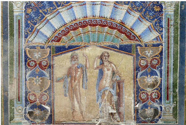
Հռոմեական բաղնիքի հափրակի խճանկար