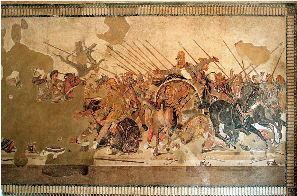
Խճանկար Պոմպեյի պեղումներից. «Գավգամելայի ճակատամարտը»