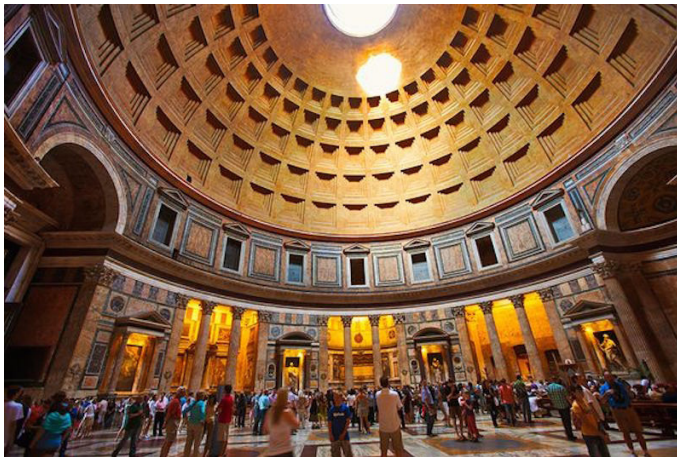
Պանթեոնի փեսքը ներսից

Տրայանոս կայսրը դակերի դեմ իր տարած հաղթանակի պատվին Հռոմում կառուցեց գեղեցիկ շենքերով շրջապատված նոր հրապարակ, որի կենտրոնում կանգնեցված էր 38 մետր բարձրությամբ նրա հուշակոթողը: Ներքևից վերև այն զարդարված էր բարձրաքանդակներով: