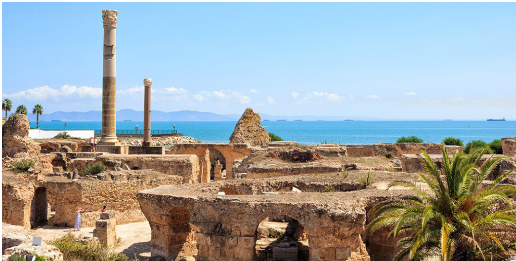
Կարթագենի ծովածոցը և քաղաքի ավերակները

Արդեն թուլացած իր երբեմնի մրցակիցների դեմ Հռոմը նոր հաղթական պատերազմներ վարեց՝ հերթականությամբ վերացնելով նրանց անկախությունը: Ք.ճ.ա. 167 թ. ջախջախվեց և հռոմեական պրովինցիա դարձավ Մակեդոնիան: Ք.ճ.ա. 146 թ. հռոմեացիները գրավեցին և կործանեցին Կարթագենը: Քաղաքի տեղն անիծվեց և աղ ցանվեց, որ այդտեղ այլևս ոչինչ չաճի: Նույն թվականին պրովինցիայի վերածեցին Հունաստանի մեծ մասը: Միայն Աթենքը և Սպարտան պահպանեցին ձևական անկախություն: