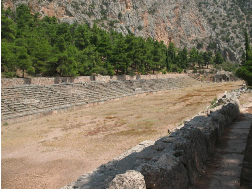
Դելֆիք. սպորտային մրցումների մարզադաշտը