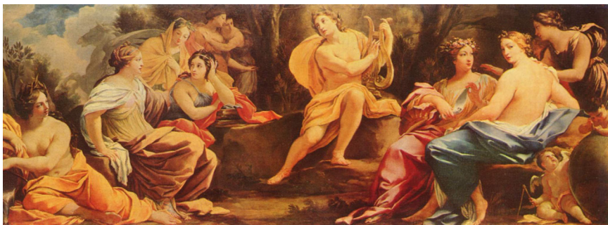
Ապոլոնը մուսաների հետ: Միջնադարյան նկար

Միջումները անցկացվում էին Դելֆիում՝ Պառնաս լեռան լանջին, որտեղ գտնվում էր Ապոլոնի փաձարը և գուշակավայրը : Հին հույները հավատում էին, որ արվեստների հովանավոր Ապոլոնը հաճախ զբոսնում է Պառնաս լեռան լանջերին՝ շրջապատված 9 մուսաներով, որոնցից յուրաքանչյուրը հովանավորում է արվեստի մի բնագավառ: