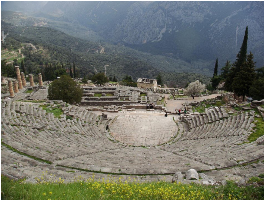
Դելֆիք. արվեստի մրցախաղերի անցկացման վայրը