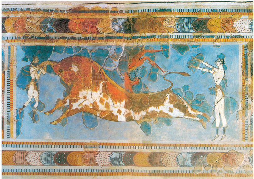
Պարկեր Կնոսոսի պալատից. Ծիսական խաղեր ցույցի հեք