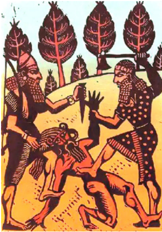
Գիլգամեշը և Էնկիդուն սպանում են հունրաբային