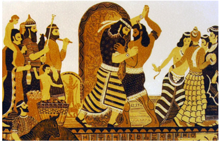
Գիլգամեշի և Էնկիդուի մենամարտը

Էպոսում պատմվում է Ուրուկ քաղաքի արքա Գիլգամեշի և նրա ընկերոջ՝ Էնկիդուի քաջագործությունների մասին: Երբ Էնկիդուն մահանում է, Գիլգամեշը որոշում է վերակենդանացնել ընկերոջը: Նա ուղևորվում է կախարդական «կյանքի խոտը» գտնելու, բայց աստվածները խանգարում են նրան՝ իր նպատակին հասնելու: