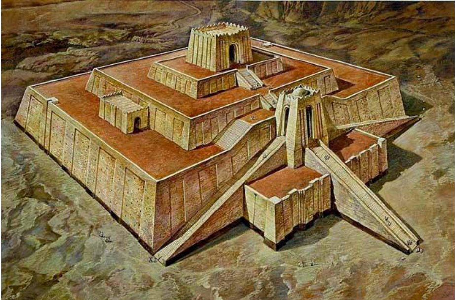
Ուր քաղաքի Ջիկուրաբը