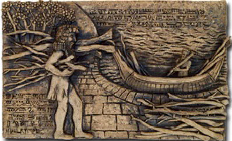
Գիլգամեշը որոնում է անմահության խոտը