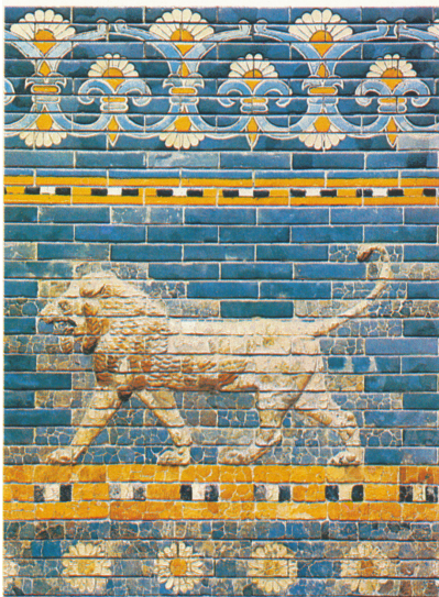
Գունավոր աղյուսներով բարձրաքանդակ Բաբելոնի հարավային պալատի գահասրահում