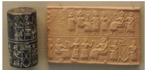
Միջագետքից գտնված զանազն կնիքներ, որոնցով ստորագրում էին պայմանագրերը և առևտրական գործարքները: Կնիքը զլորում էին խոնավ կավե փախարակի վրա և ստացվում էր համապատասխան պատկեր-ստորագրություն: