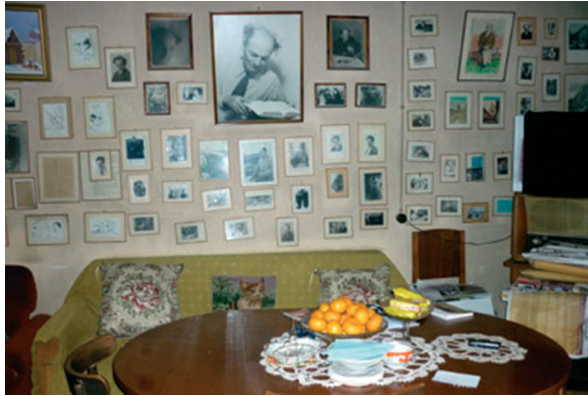
Գուրգեն Մահարիի փան հյուրասենյակ-թանգարանը Պալանգայում

Գուրգեն Մահարին մահացել է 1969 թ. հունիսի 17-ին, Պալանգայում (Լիտվա), թաղված է Երևանում: