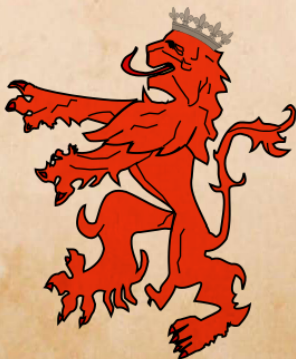
Կիլիկիայի Հայկական թագավորության դրոշը