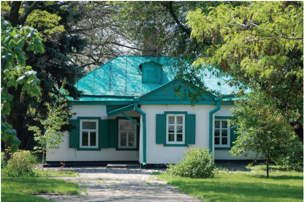
Չեխովի հայրական տունը, Տազանրոզ, Ռուսաստան

Գրել է շուրջ 900 ստեղծագործություն՝ բազմաթիվ պատմվածքներ, վիպակներ, պիեսներ: Նրա «Ճայր», «Քեռի Վանյան», «Երեք քույր» և «Բալենու այգին» պիեսները ճանաչվել են համաշխարհային դրամատուրգիայի դասական ստեղծագործություններ: Պատմվածքներից աչքի են ընկնում «Կաշտանկան», «Շնիկով տիկինը» և այլն: Չեխովի բոլոր հիմնական երկերը թարգմանվել են հայերեն: