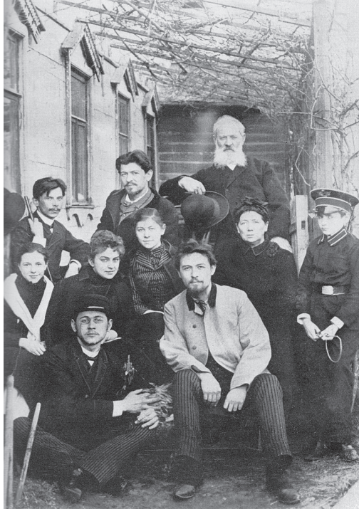
Չեխովի ընտանիքն ու ընկերները, 1890 թ.

Անտոն Չեխովը ծնվել է 1860 թվականի հունվարի 29-ին (հին տոմարով՝ հունվարի 17-ին)՝ Անտոն Մեծի տոնակատարության օրը, Տագանրոգ քաղաքում: Անտոնի հայրը՝ Պավել Եգորովիչ Չեխովը, գյուղացու զավակ էր, որն ամուսնացել էր ուկրաինուհու հետ: Պավել Չեխովը հայտնի էր որպես կրոնական-պահպանողական ավանդներին հավատարիմ քաղքենի առևտրական: Նա իր որդիներին պարտադրում էր հաճախել եկեղեցի և ճշտությամբ կատարել կրոնական բոլոր ծեսերը, ինչպես նաև ստիպում էր նրանց կատարել խանութի գործակատարի պարտականությունները: Մանկության այդ ծանր տարիներից էլ սկսվում է Անտոնի այնքան յուրահատուկ և բացահայտ ատելությունը քարացած ավանդույթների, կրոնի և եկեղեցու նկատմամբ: Չեխովի մայրը՝ Եվգենյան (Մորոզովա), հոյակապ հեքիաթասաց էր, որը վաճառական հոր հետ շրջելով ողջ Ռուսաստանով, երեխաներին հեքիաթներ էր պատմում: «Մենք տաղանդը ժառանգել ենք հորից, հիշում է Չեխովը,- իսկ մեր հոգին՝ մորից»: