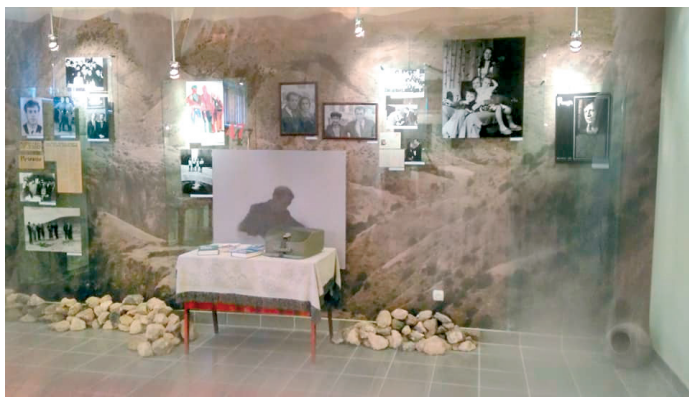
Մուշեղ Գալշոյանի փուն-թանգարանը Կաթնաղբյուր գյուղում

Լրագրական հոդվածներին զուգընթաց՝ 1983 թ. Մ. Գալշոյանը գրեց իր առաջին վիպակը՝ «Ձորի Միրոն»: