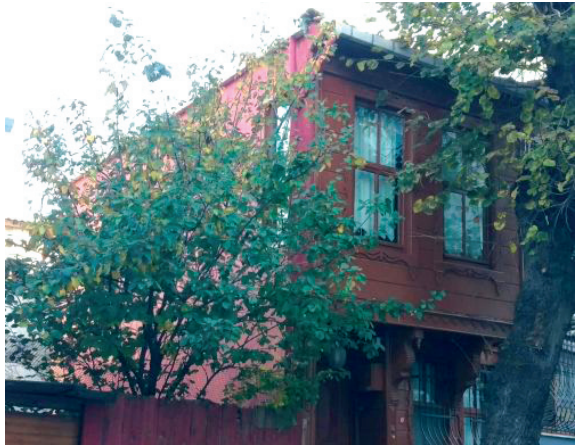
2. Եսայանի մորեղբոր տունը «Սիլիհտարի պարտեզներ» թաղամասում, որտեղ ապրել է ինքը՝ Զ. Եսայանը:

1915 թ. նա կարողացավ փրկվել երիտթուրքերի հալածանքներից և ապաստանեց Բուլղարիայում: Որոշ ժամանակ թաքնվում էր այնտեղ, իսկ 1916 թ. գալիս է Կովկաս և սկսում ծավալել գրական ու հասարակական լայն գործունեություն: Նա ցանկանում էր աշխարհի ուշադրությունը հրավի-